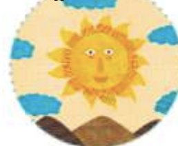
De ga nde mä pa